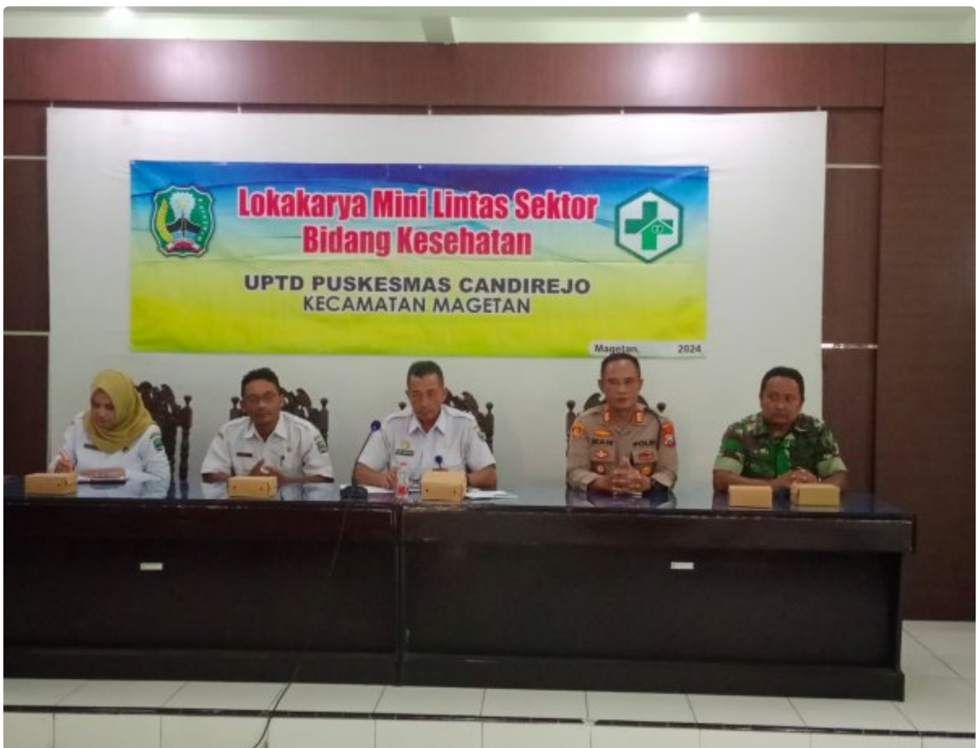
Bati TUUD Koramil 0804/01 Magetan Hadiri Loka Karya Mini Lintas Sektor Tri Bulanan Bidang Kesehatan

MAGETAN. - Bati TUUD Koramil Tipe B 0804/01 Magetan Kodim Magetan Pelda